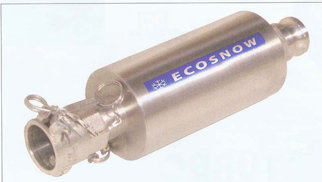
Der Schneekatalysator wird ab sofort unter dem Markennamen ECOSNOW vertrieben