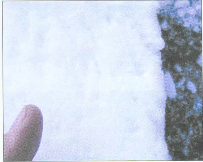
Der Schnee wird durch den Katalysator feinkörniger und trockener

Kleinere Wassertropfen gefrieren schneller, was einen großen Vorteil bei Grenztemperatur bringt und die Schneekanone schon ein Grad früher Schnee machen lässt.